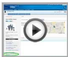
Get connected to people