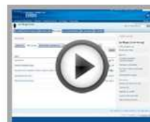
Join a group