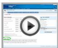
Set up your privacy