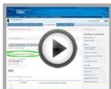
Create your basic profile