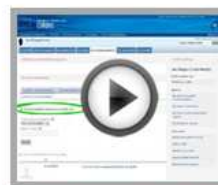
Ask for a recommendation