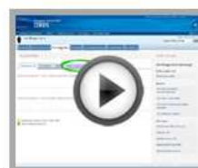
Create a partnership request